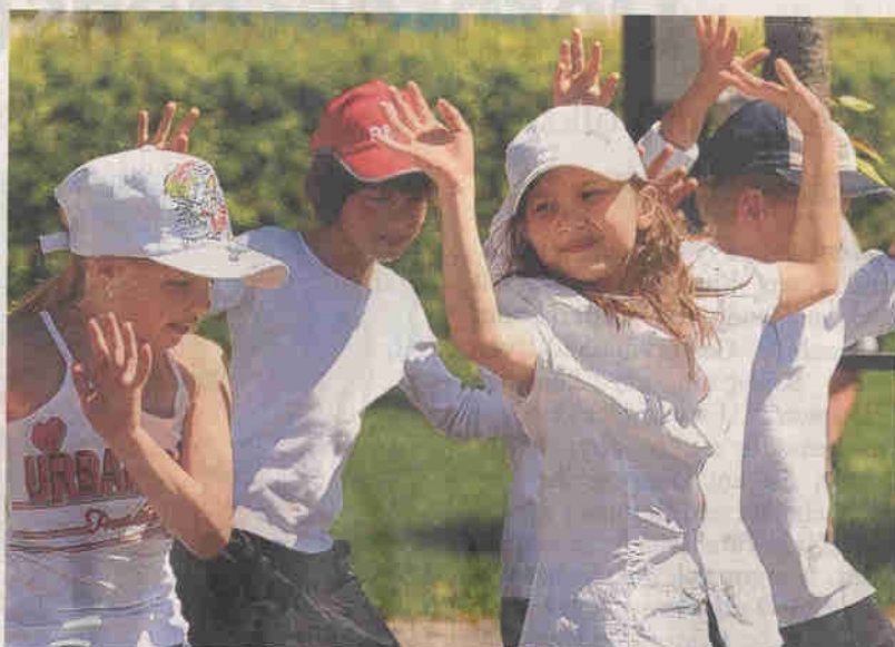
Mädchen und Buben der Werner-Egk-Schule eröffneten das Fest in Oberhausen-Nord mit einem Tanz.